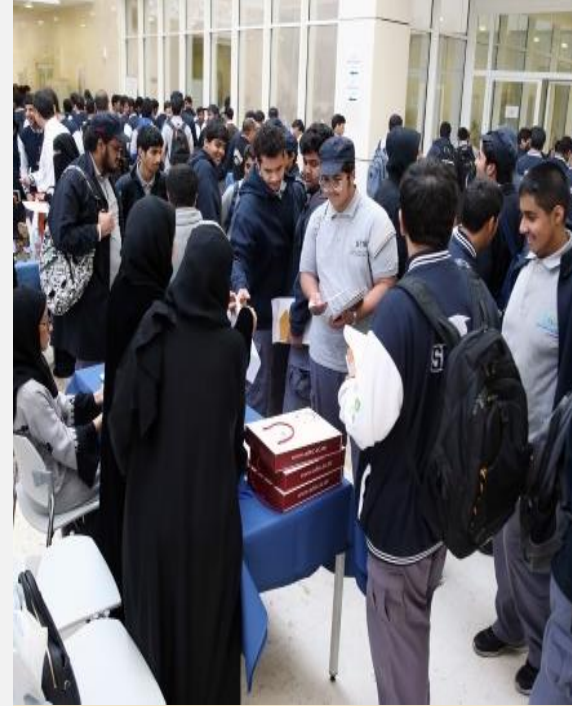
طلبة الصف 12